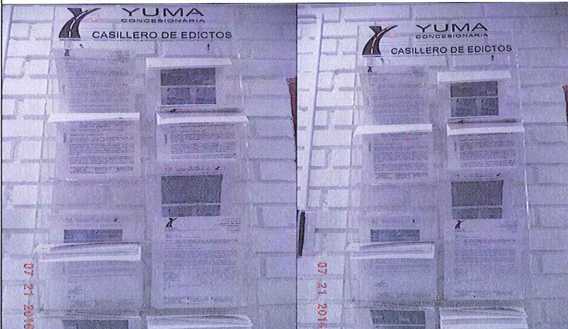
EDICTOS DE LA R_14239 YC-CRT-41281